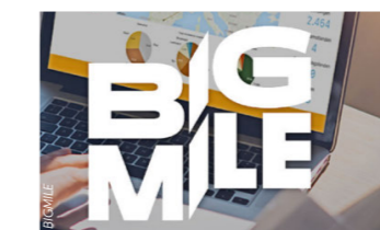
BigMile SaaS-Plattform für die Kalkulation und Analyse der CO 2 -Emissionen