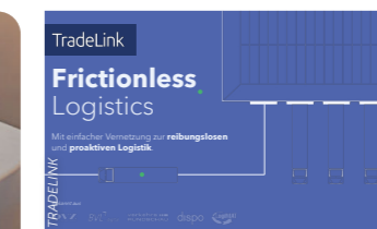
TradeLink Eine einfache und effektive Form der Lieferabstimmung rund um das Lager